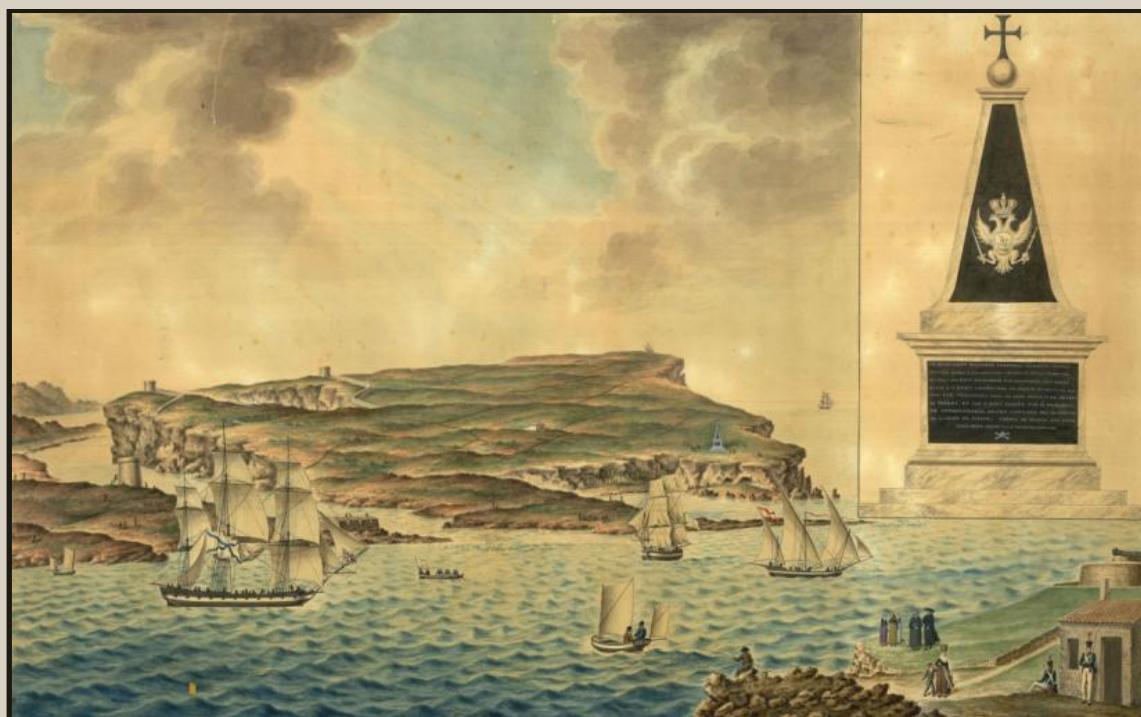
Cuadro de la Mola, y el monumento de los marinos rusos