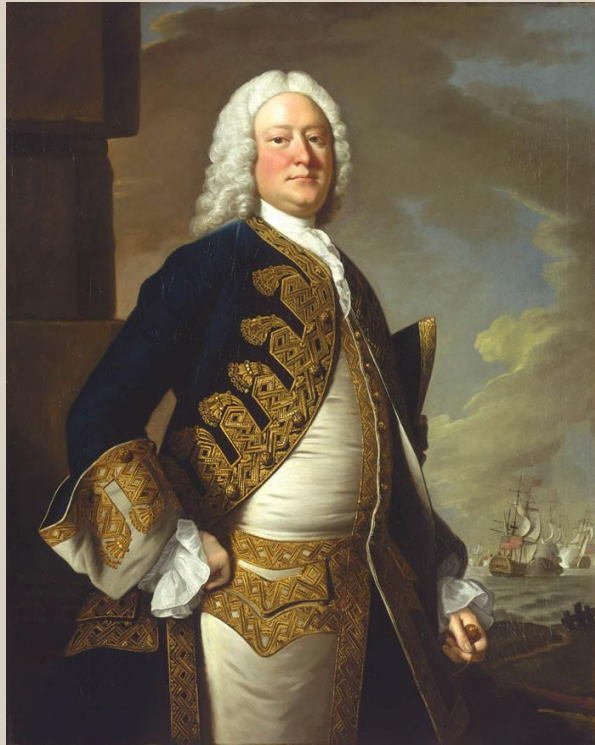
Almirante John Byng (1704 – 1757)